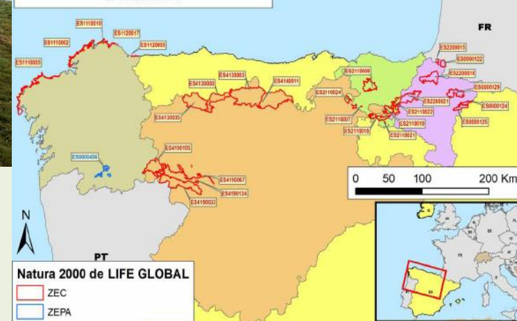
MAPA DE LOCALIZACIÓN POR REGIONES E 1:4.000.000